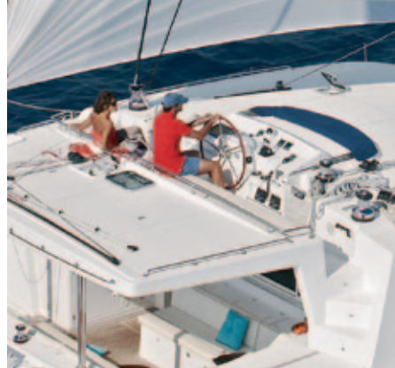
04 - 05