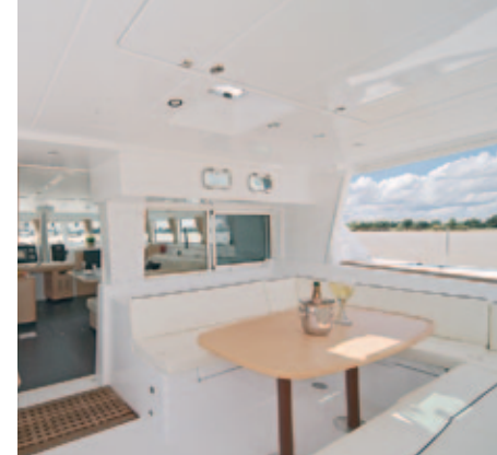
09 - 10